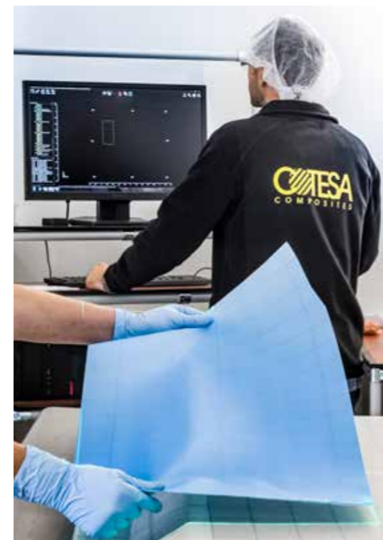
Die LAP PRO-SOFT Software steuert die Arbeitsschritte von der Projektion bis zur Generierung auftragsbezogener Logfiles.