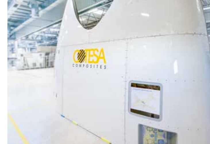
Auf rund 12.000 Quadratmetern fertigt COTESA im sächsischen Mochau Rumpfbauteile aus hochwertigen Faserverbundbauteilen für die A320-Familie.

Insgesamt sieben Laminierstationen sind mit der digitalen Lasertechnik ausgestattet. COTESAs Wahl fiel auf diodenbasierte LAP CAD-PRO Laserprojektoren mit grüner Laserquelle. Diese Laser verfügen über eine Betriebsdauer von mehr als 30.000 Stunden, sind fokussierbar und sorgen für gute Sichtbarkeit der Laserlinien. Dies alles trägt zur Prozesssicherheit bei. Das Laserprojektionssystem bringt zudem genau die Flexibilität mit, die bei unterschiedlichen Bauteilgrößen zwischen drei und sechs Quadratmetern benötigt wird. So sind für die Bearbeitung größerer, komplexerer Tools an mehreren Arbeitsstationen bis zu vier Projektoren im Verbund gruppiert. Mit dem Laserprojektionssystem hat COTESA die technische Infrastruktur geschaffen, um zukünftig noch schneller und effizienter produzieren zu können.