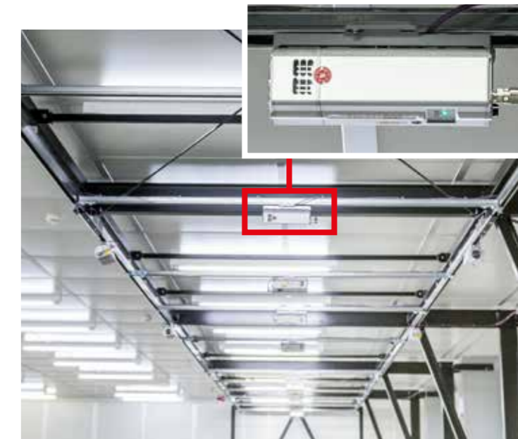
Die LAP CAD-PRO Laserprojektoren sind an der Decke über den Laminierstationen installiert. Das System ist flexibel konfigurierbar – von kleinen bis zu großen Werkzeugen, die auf mobilen Tischen in den Projektionsbereich gefahren werden.